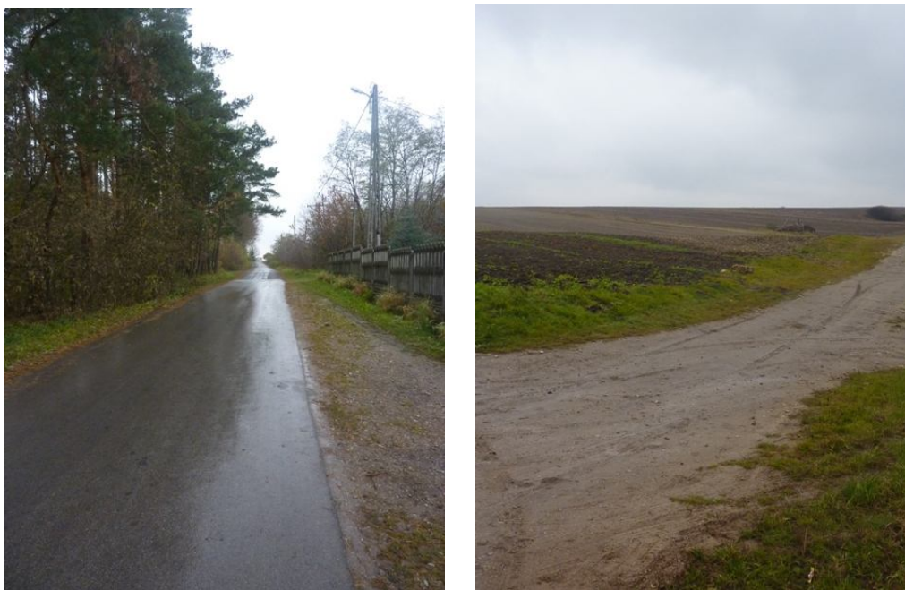
Zdjęcie 13: Nawierzchnia dróg w Nizinach

Przez miejscowość przebiega droga gminna Niziny-Staniowice nr 383013T, o dł. 4220m.