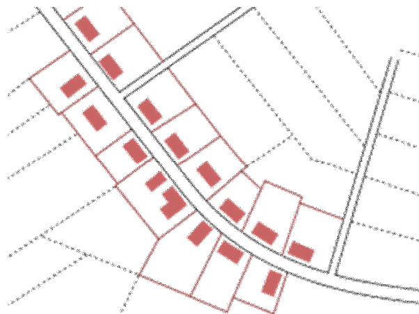
Zdjęcie 4: Zdjęcie z Planu Zagospodarowania Przestrzennego, wieś ulicówka.

W miejscowości brak jest budynków pełniących funkcję społeczne, brak jest również budynku pełniącego funkcję dominanty przestrzennej.