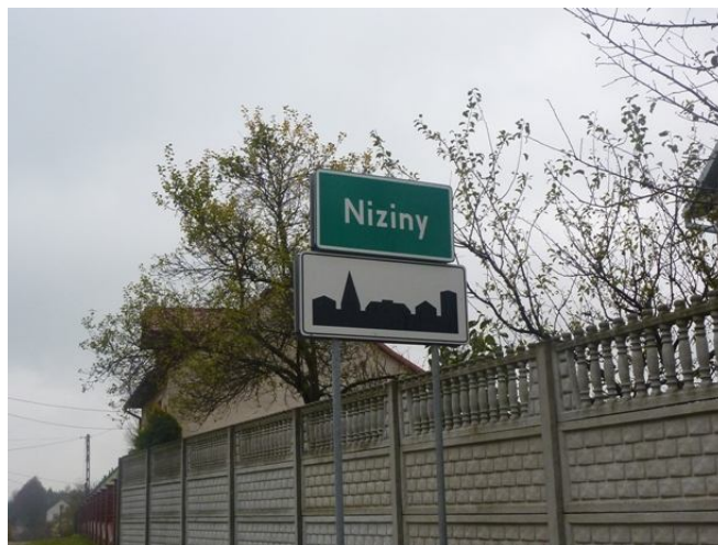
Zdjęcie 2: Znak miejscowości oraz terenu zabudowanego

Terytorium Gminy Sobków ma charakterystyczny kształt, rozciąga się wzdłuż rzeki Nidy, obejmując jej górny bieg.