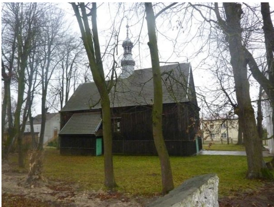
Zdjęcie 6: Stary Kościół pw. św. Marii Magdaleny w Chomentowie

Niziny należą do parafii pod wezwaniem św. Marii Magdaleny, której Kościół usytuowany jest w miejscowości ościennej Chomentów. Pierwszy kościół został postawiony jako budynek drewniany.