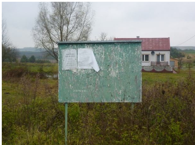
Zdjęcie 12: Tablica informacyjna w Nizinach

W budynku szkoły znajduje się również Gminna Biblioteka Publiczna w Sobkowie filia w Chomentowie, z której mogą korzystać mieszkańcy Nizin.