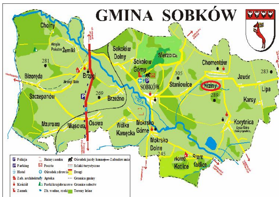
Mapa 3: Wieś Niziny na tle Gminy Sobków

Sołectwo Niziny położone jest w centralnej części Gminy Sobków i posiada współrzędne geograficzne 50^{\circ}40'43''\text{N} i 20^{\circ}30'52''\text{E} . Odległość od stolicy województwa-Kielce wynosi 26,1 km (drogą krajową 73), od stolicy powiatu-Jędrzejowa-21,7 km oraz od Urzędu Gminy w Sobkowie - 5,6 km.