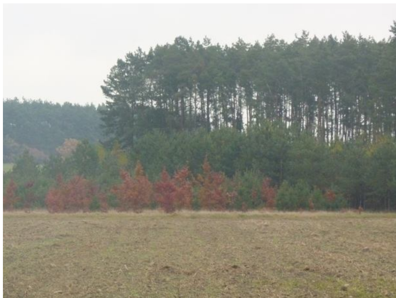
Zdjęcie nr 3 - Lasy w miejscowości Wierzbica.

Atutem terenów miejscowości Wierzbica jest bliskość lasów. Obfitują one w grzyby, jagody, poziomki. Lasy są korytarzem czystego powietrza i przeciwwagą dla zanieczyszczeń powietrza, które są udziałem funkcjonującej kopalni.