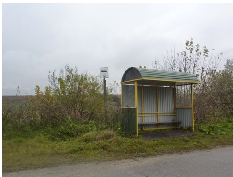
Zdjęcie nr 7 - Najbliższy przystanek dla mieszkańców Wierzbicy zlokalizowany jest w miejscowości Sobków.

W Wierzbicy brak jest zorganizowanego transportu zbiorowego. Najbliższy przystanek znajduje się w Sobkowie. Mieszkańcy indywidualnie muszą przemieścić się do pobliskiej miejscowości, skąd mogą dalej podróżować. Wyjątkiem jest autobus szkolny dowożący dzieci w wyznaczonych godzinach do szkoły podstawowej i gimnazjum w Sobkowie.