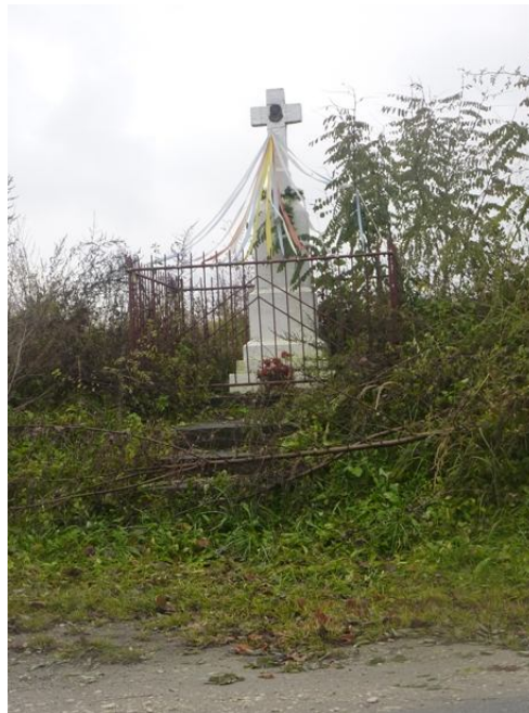
Zdjęcie nr 5 i 6 - Przydrożne krzyże w miejscowości Wierzbica.

W opinii mieszkańców Wierzbicy stan infrastruktury społeczno-kulturalnej dostępny w ich miejscowości nie jest zadowalający (opinie ze spotkania roboczego w sprawie POM). W zasięgu swojej miejscowości nie posiadają żadnych sprzyjających integracji mieszkańców miejsc i budynków. Taki stan jest również powodem migracji młodych mieszkańców poza granice sołectwa, do miejsc bardziej przyjaznych społeczności lokalnej. W tym względzie, aby poprawić sytuację mieszkańców należy dokonać wszelkich starań, aby stworzyć miejsce, gdzie mieszkańcy ci najmłodsi i ci starsi będą mogli spędzać wspólnie czas.