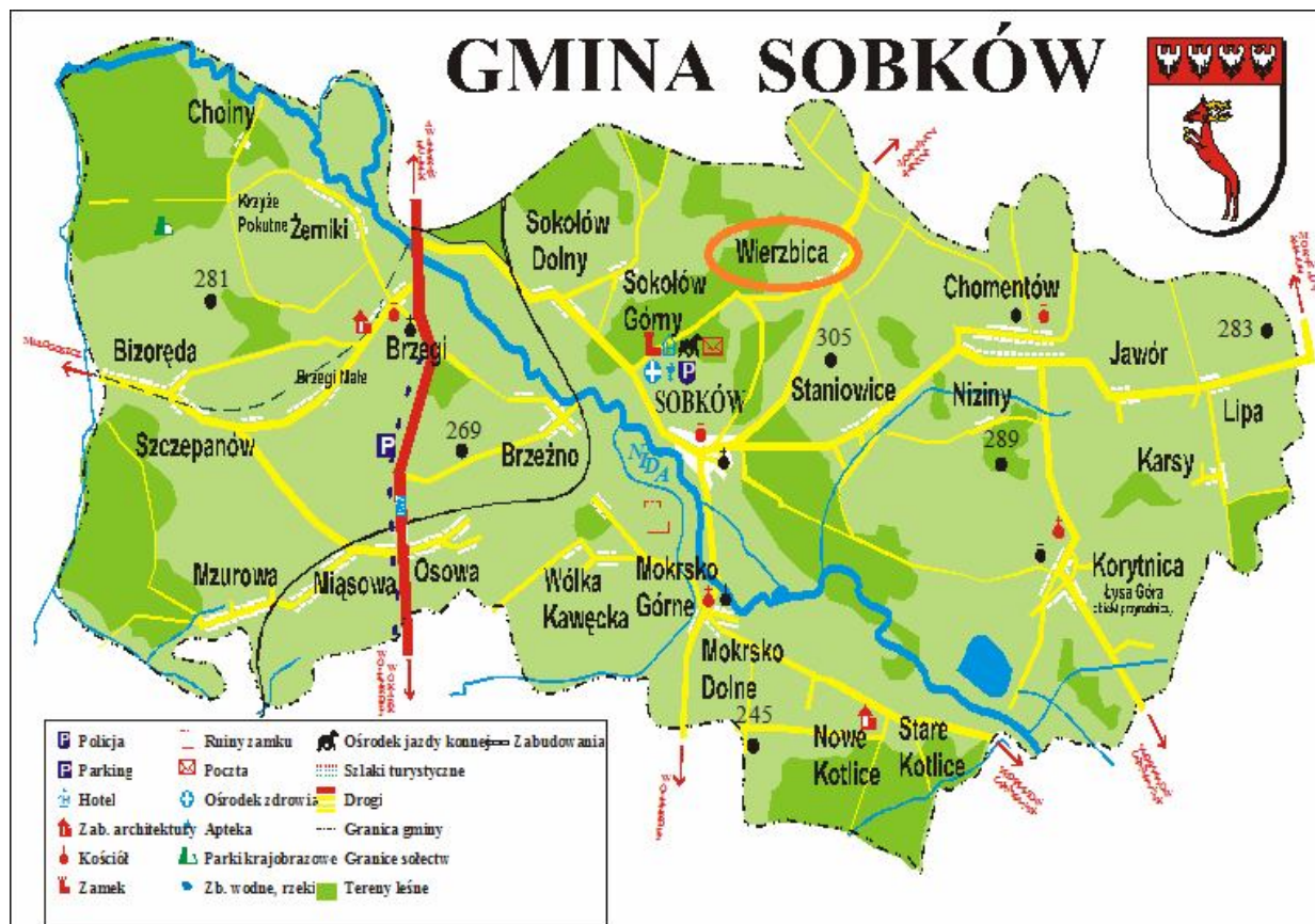
Mapa Gminy Sobków – za: www.sobkow.pl

kieleckim. Obecnie położone jest w Gminie Sobków, powiecie Jędrzejewskim oraz posiada współrzędne geograficzne: 50°42'17"N i 20°29'43"E. Wierzbica położona jest w odległości od stolicy województwa Kielc o ok. 29km., od stolicy powiatu Jędrzejowa o około 20km oraz do Sobkowa o ok. 5km.