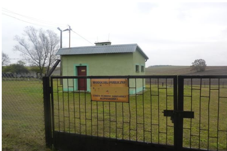
Zdjęcie nr 8 – Ujęcie wody w miejscowości Wierzbica.

Sołectwo Wierzbica posiada sieć wodociagową o średnicy \varnothing 90mm zaopatrywaną z ujęcia wody zlokalizowanego w południowej części wsi. Ujęcie składa się z jednej studni, o wydajności 15m 3 /h przy depresji 1,5m. Przysiółek Gajówka wyposażony jest w sieć wodociagową o średnicy \varnothing 90mm zaopatrywaną z ujęcia wody zlokalizowanego w najbardziej wysuniętym na północ fragmencie sołectwa Wierzbica. Ujęcie składa się z jednej studni, o wydajności 4m 3 /h przy depresji 7m.