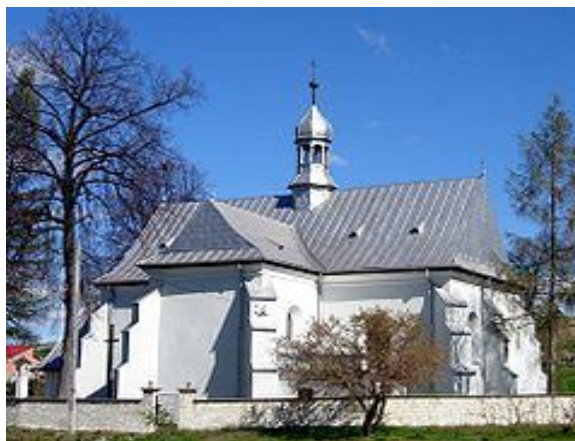
Zdjęcie nr 4 - Kościół Św. Stanisława w Sobkowie.

Mieszkańcy Wierzbicy należą do Parafii św. Stanisława w Sobkowie. Kościół wybudowano ok. 1560 r. Świątynia jest zbudowana na planie krzyża złożonego z nawy, do której przylegają dwie symetryczne kaplice oraz równego korpusowi szerokością prezbiterium. Ołtarz główny pochodzi z 2 poł. XVII w.