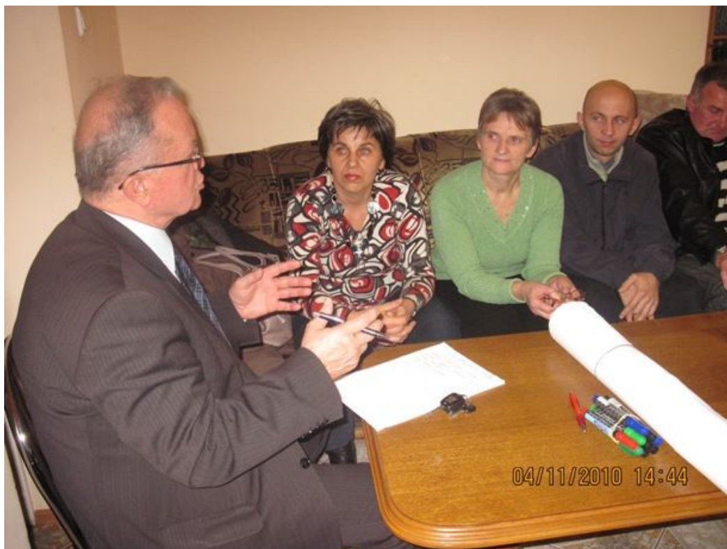
Zdjęcia nr 1 i 2 - zebranie robocze w sprawie Odnowy wsi w miejscowości Wierzbica w dniu 4 listopada 2010r.