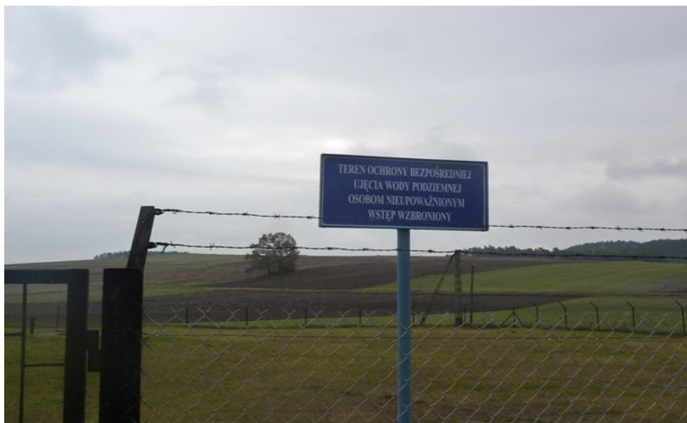
Zdjęcie nr 9 – Ujęcie wody w miejscowości Wierzbica.